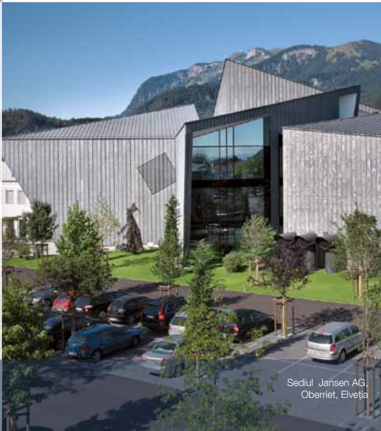
Sediul Jansen AG, Oberriet, Elveția

Compania Jansen AG, fondată în 1923, produce și comercializează țevi sudate și trase și sisteme din profile de oțel și oțel inoxidabil pentru ferestre, uși și fațade precum și produse din mase plastice pentru industria construcțiilor. Grupul Jansen este 100% în posesiune privată. Cele mai moderne utilaje de producție și investiții continue pentru asigurarea calității fac ca produsele Jansen să fie recunoscute pe plan mondial ca sinonim pentru calitatea elvețiană și inovație. Grupul Jansen are peste 1000 de angajați și este activ pe plan mondial prin reprezentanțe și firme partener.